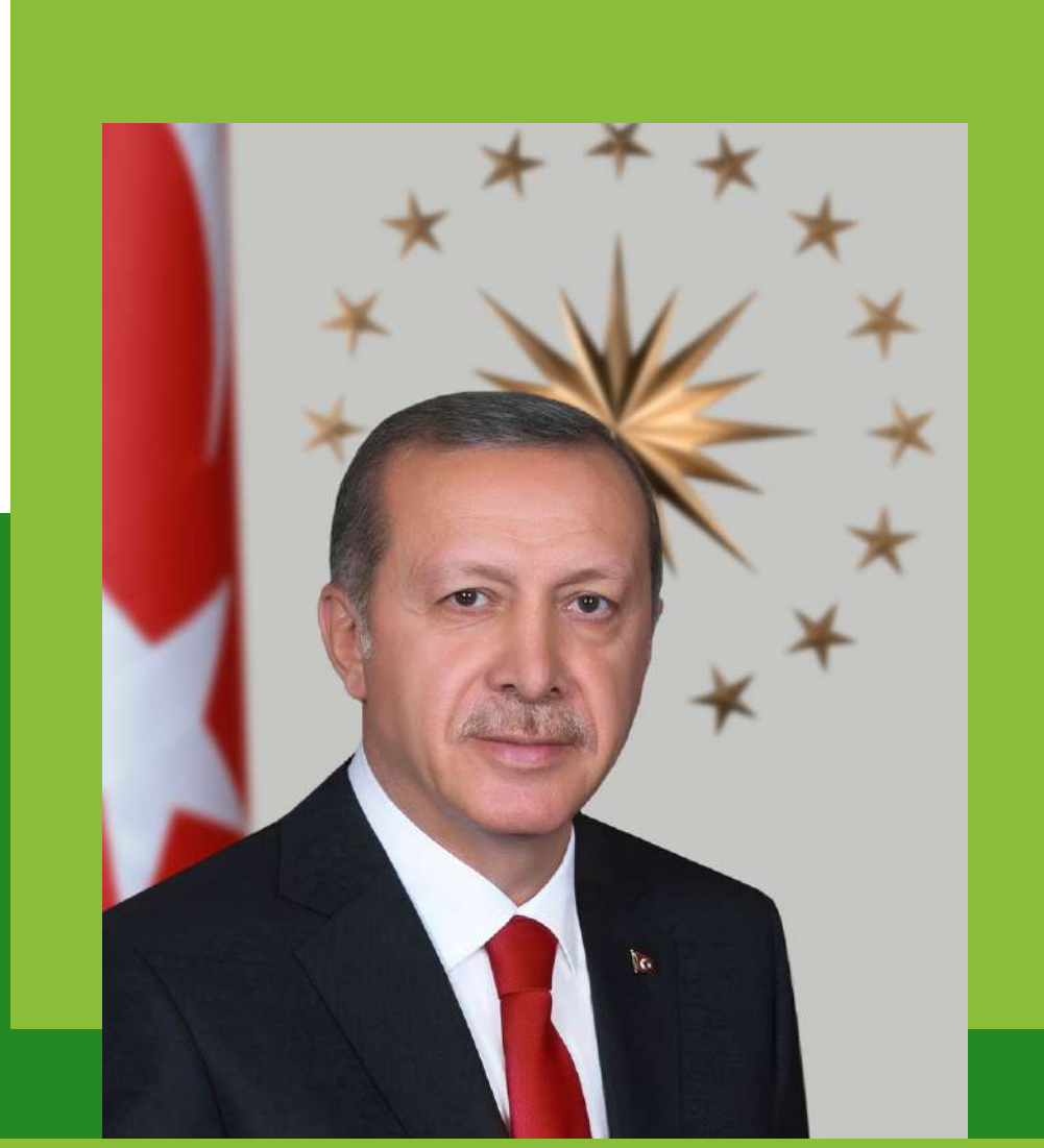
Cumhurbaşkanı Sayın Recep Tayyip ERDOĞAN